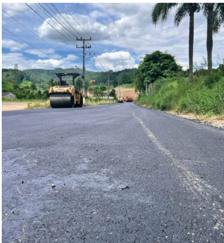
Ruas Newton Marcelino e Renato Bonetti ganham asfalto

Outras pavimentações estão previstas para serem autorizadas nos meses subsequentes, solidificando o compromisso da administração municipal com o desenvolvimento urbano e a qualidade de vida dos cidadãos.