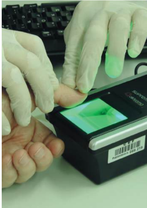
Cadastro biométrico é um dos serviços que serão disponibilizados na ação

Iniciativa busca garantir o acesso democrático e simplificado aos cidadãos.