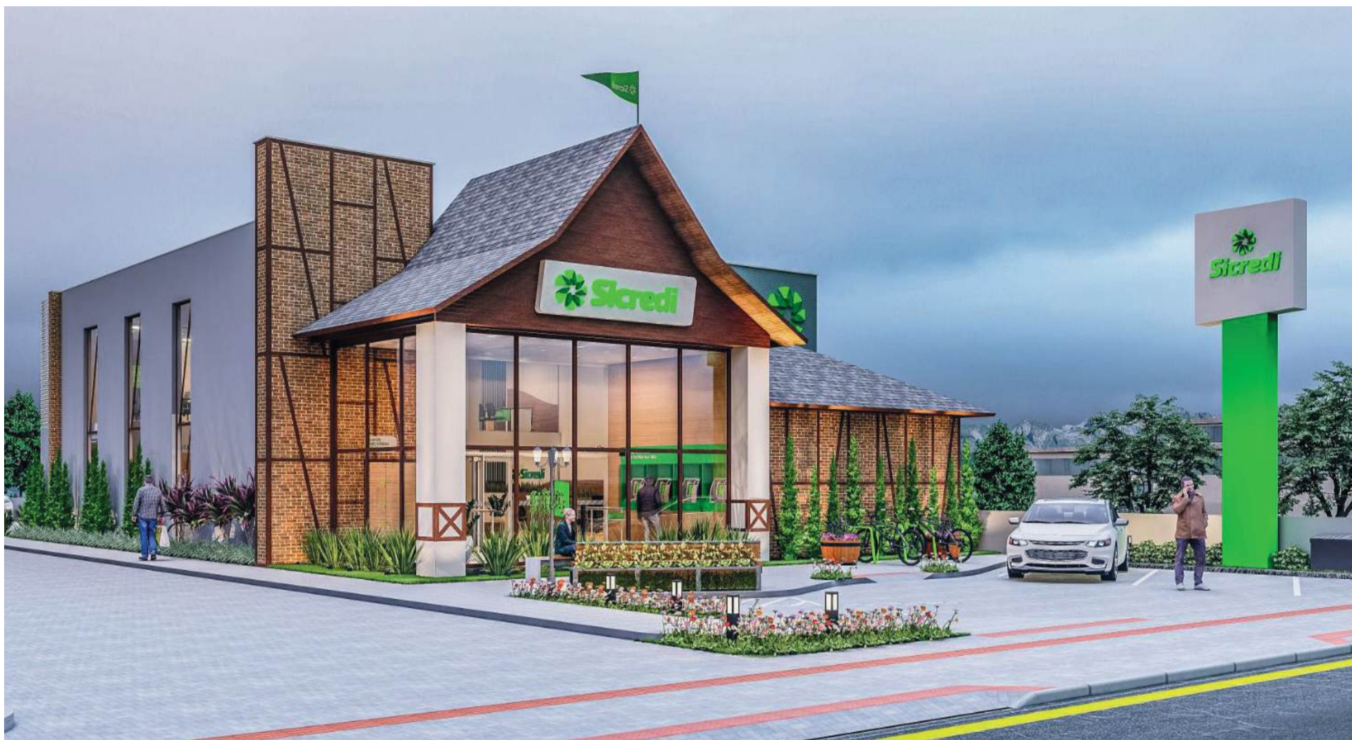
Projeto arquitetônico da nova agência foi inspirado nas raízes alemãs da cidade, utilizando a técnica construtiva enxaimel, trazida pelos imigrantes